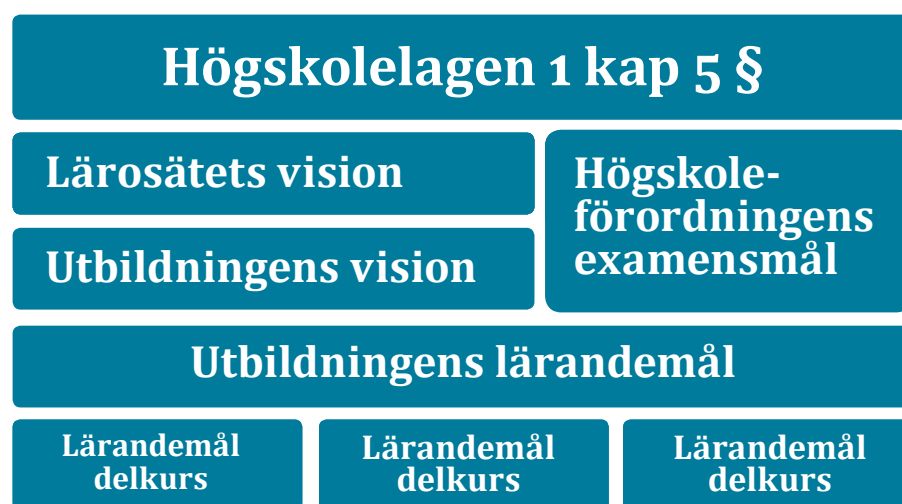
Figur 1. Högskolelagen och lärandemålen

Enligt högskolelagen 1 kap 5 § bör lärosätena i sin verksamhet "främja förståelsen för andra länder och för internationella förhållanden". 17 Det är upp till varje lärosäte att definiera vad detta innebär för respektive utbildning. Innehållet i utbildningarna beskrivs i lärandemål som bygger på examensmålen såsom de är preciserade i examensordningen i bilagan till högskoleförordningen. För det enskilda lärosätet ligger det därför närmast till hands att tydliggöra internationella och interkulturella aspekter i utbildningens lärandemål. Det kan ses som en kedja där högskolelagen 1 kap 5 § i idealläget avspeglas i lärosätets och utbildningarnas (internationella) vision, vilka i sin tur påverkar utbildningens lärandemål.