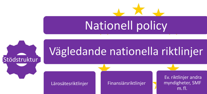
Figur 5. System för ansvarsfull internationalisering.

Därutöver föreslår myndigheterna vägledande nationella riktlinjer som redogör för vilka bedömningar och ställningstagande som bör beaktas i internationella aktiviteter som samarbeten eller rekryteringar. Någon myndighet som regeringen utpekar bör få ansvar för att stödja implementeringen av riktlinjerna och uppdatera dem.