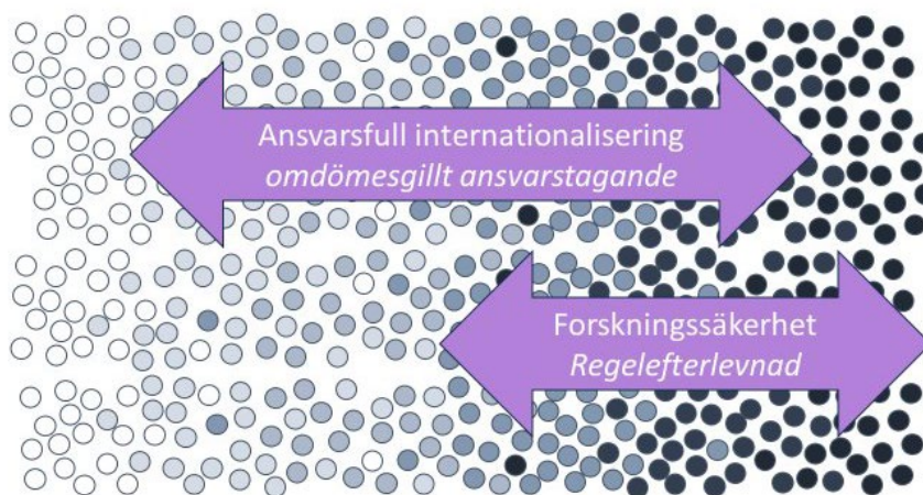
Figur 4. Riskspektrum.

I ett teoretiskt riskspektrum är de grå nyanserna jämnt graderade efter spektrumet. Men i verkligheten kan samarbeten som inledningsvis ses som riskfria visa sig efter bedömning eller när samarbetet har inletts ha högre risk (det vill säga en mörkare prick till vänster i spektrumet) och vice versa, det vill säga att samarbeten som initialt tros ha hög risk visar sig efter bedömning vara relativt problemfria (en ljusare prick till höger i spektrumet).