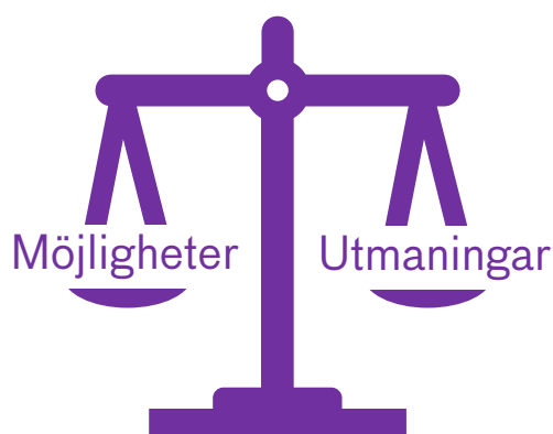
Figur 2. Sammanvägning av möjligheter och utmaningar.

I den samlade bedömningen av ansvarsfullhet i ett internationellt initiativ är det därför av yttersta vikt att identifiera vilka fördelar det aktuella internationella initiativet ger för att väga dem mot eventuella utmaningar.